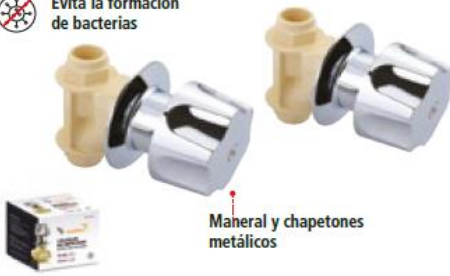
Maneral y chapetones metálicos