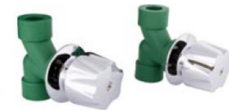
Maneral y chapetones metálicos